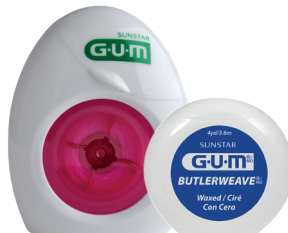
1155 GUM Butlerweave® cerato - 906668076