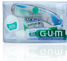
156 GUM Travel Kit - 902311606