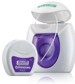
2030 GUM Expanding Floss - 900415100