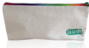
124KITECO24 KIT ECO ORTODONTICO 528KITECO24 KIT ECO IGIENE QUOTIDIANA