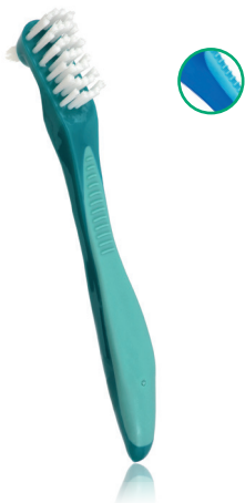
201 GUM Denture Brush per protesi - 902222850