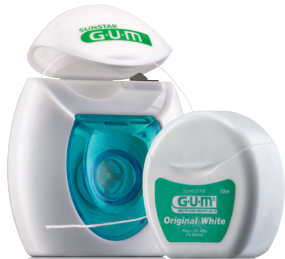
2040 GUM Original White floss - 904802749