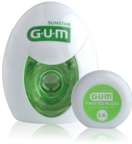
3500 GUM TWISTED FLOSS - 984881019