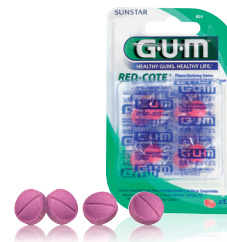
800 GUM Red-Cote® pastiglie rivela placca - 902224195