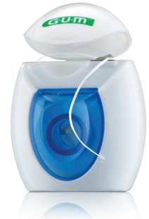
2000 GUM Easy-Floss - 935689808