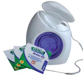
3220 GUM Ortho Floss - 933015238