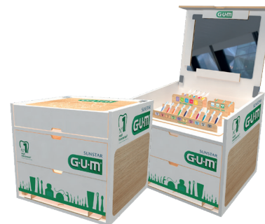
GUM WONDER BOX