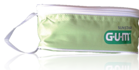
528KITPREST KIT PRESTIGE PREVENZIONE MALATTIE SISTEMICHE 124KITPREST KIT PRESTIGE ORTODONTICO 317KITPREST KIT PRESTIGE POST OPERATION