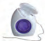
Nić GUM ORTHO