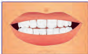
Wygląd zębów po zakończeniu leczenia przy dobrej higienie jamy ustnej