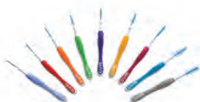
Szczoteczki GUM TRAV-LER