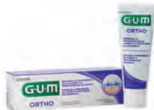
Pasta GUM ORTHO