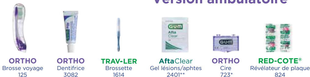
ORTHO Brosse voyage 125