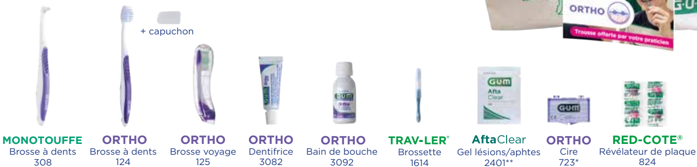
MONTOUFFE Brosse à dents 308