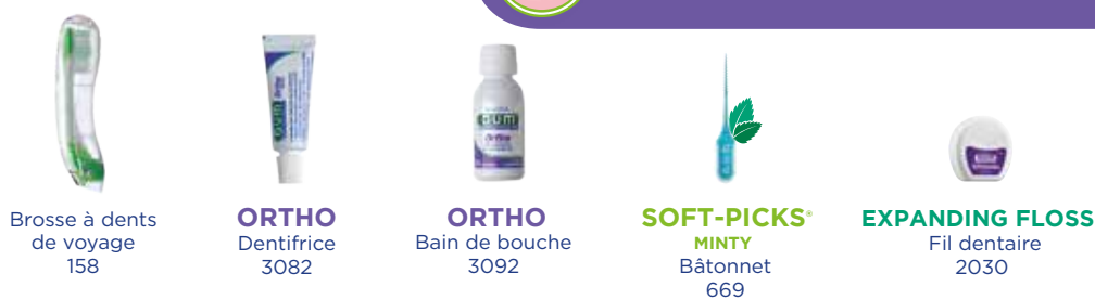
Brosse à dents de voyage 158