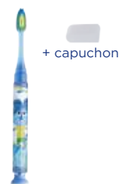
TIMER-LIGHT Brosse à dents 903